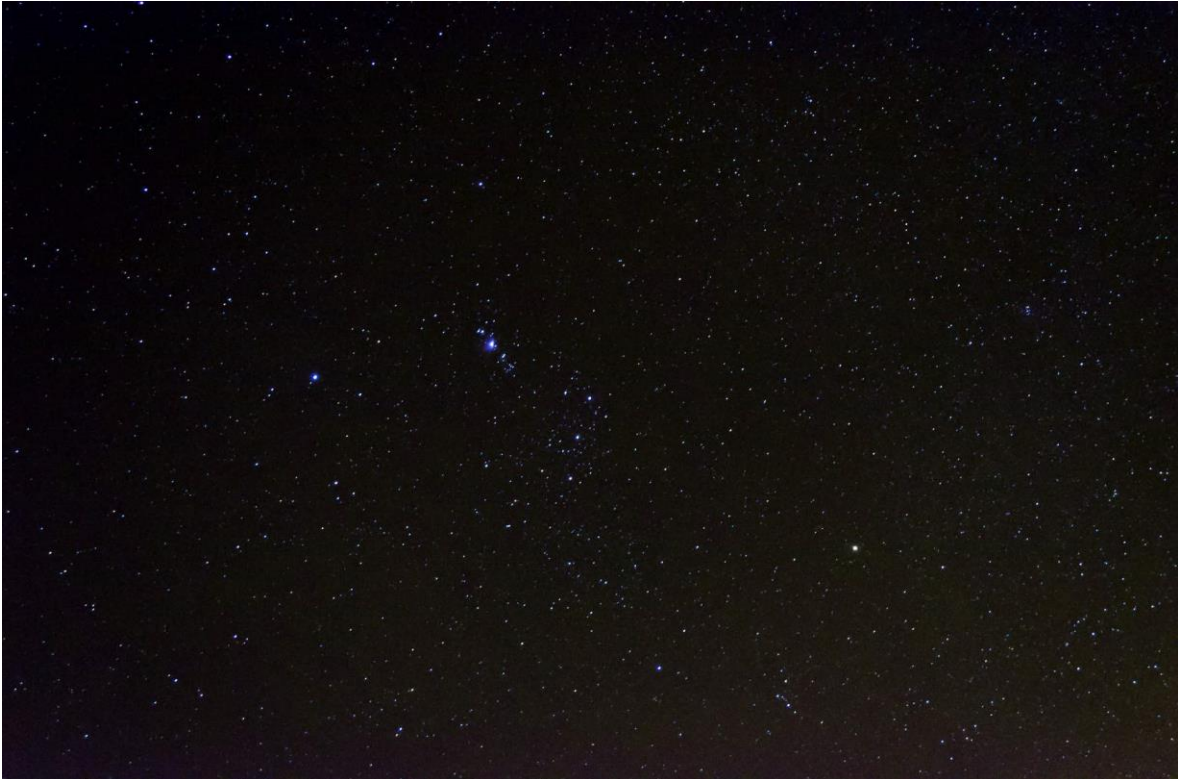
Imagen 2 – Sector Constelación de Orión.

Puedes ver la imagen en alta calidad acá: