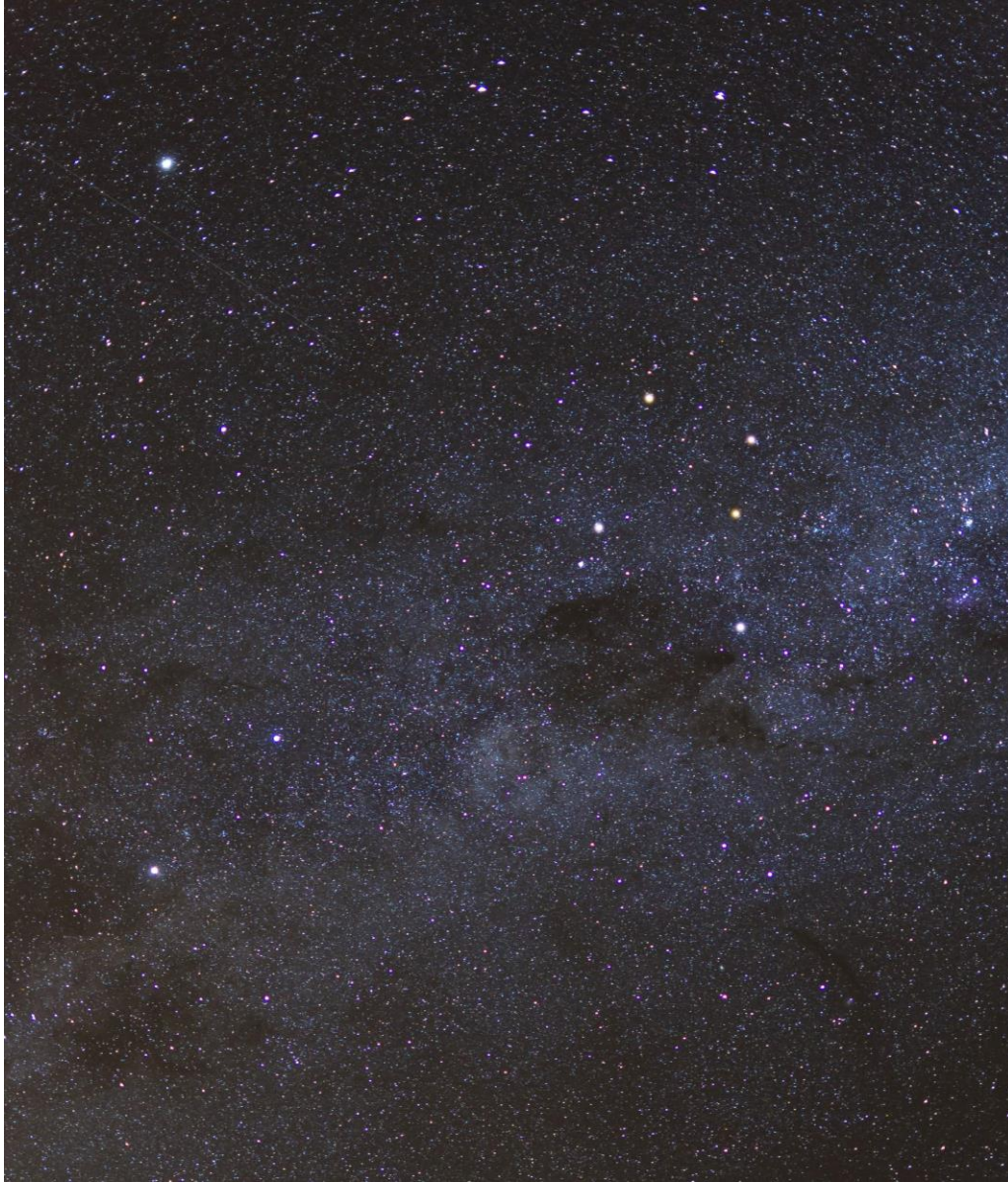
Imagen 1 – Sector Constelación Cruz del Sur.

Puedes ver la imagen en alta calidad acá: https://drive.google.com/file/d/1W-Ey-LOqasAR5xU_oNDQuBWWuLW00IxE/view