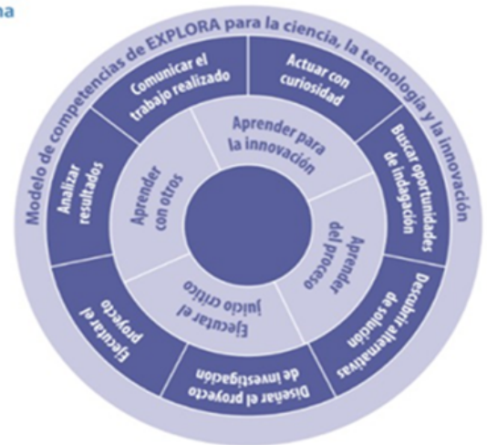
Modelo de competencias científicas del Programa Explora

La ruta de acompañamiento para la progresión del modelo de competencias Explora se realizará con cada equipo ANL siguiendo la siguiente planificación: