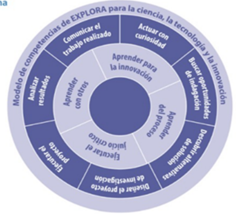
Modelo de competencias científicas del Programa Explora

La ruta de acompañamiento para la progresión del modelo de competencias Explora se realizará con cada Club siguiendo la siguiente planificación: