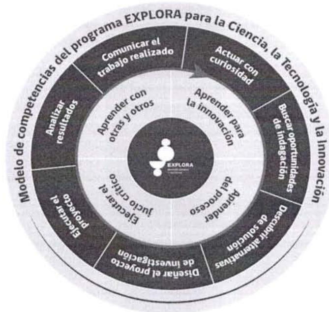
Figura 1: Modelo de Competencias del programa Explora.

En su definición, cada competencia establece las diferentes acciones específicas, comportamientos o resultados que se espera sean capaces de realizar y lograr las y los estudiantes. Se solicita que este Modelo de Competencias se encuentre explícito en la ruta formativa del instrumento y sea transversal al diseño de las actividades (ver tablas 2 y 3).